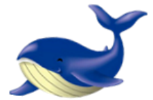
とかしきーケラ丸くん

4. 期 日 令和4年 8月 7日(日) ～ 8月 9日(火) 2泊3日 予 備 日 令和4年 9月 17日(土) ～ 9月 19日(月) 2泊3日