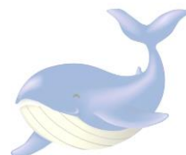
とかしきケラ丸くん